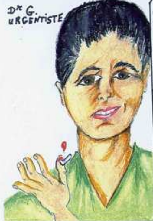
DR G. URGENTISTE

PAS LE TEMPS : C'ÉTAIT UNE URGENCE ... D'HABITUDE FAIRE LA TOILETTE, OH! J'EN METS PAS POUR RASER ! POUR JE POUVAIS PAS PRÉVOIR! J'ÉTAIS EN RETARD, ET IL Y AVAIT TELLEMENT DE BOULOT !